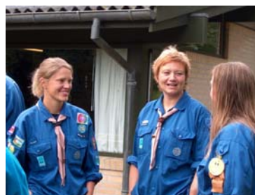
Fra DBS´s hjemmeside

Spejderbevægelsens grundide lyder: Ud fra et religiøst og alment etisk grundlag at påvirke den enkelte spejder til en positiv personlig udvikling gennem samværet med jævnaldrende i en opdragende leg med naturoplevelser og praktiske / kreative aktiviteter. Herigennem opøves til selvstændighed, venskab over alle grænser og hjælpsomhed.