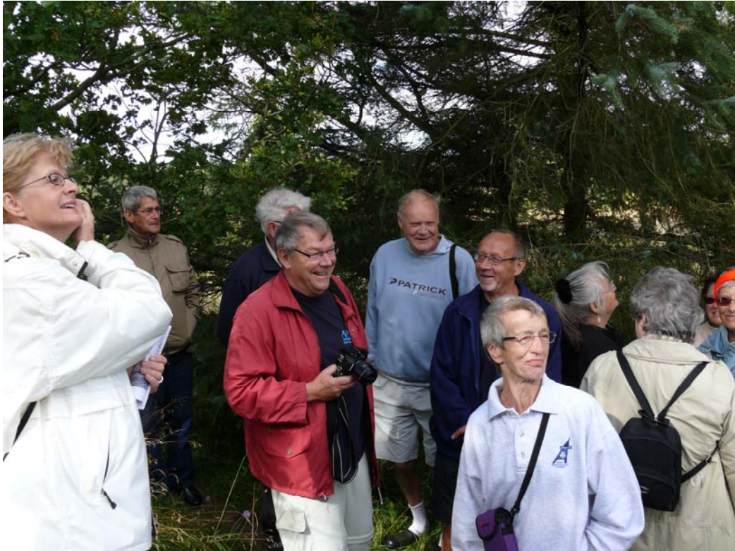
Fra Landsgildeweekenden 2007