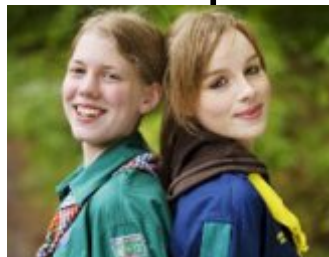
To spejdere.

I Danmark har vi seks spejderkorps og FDF. Men hvor gammel er spejderbevægelsen egentlig og hvorfor har vi seks spejderkorps i Danmark?