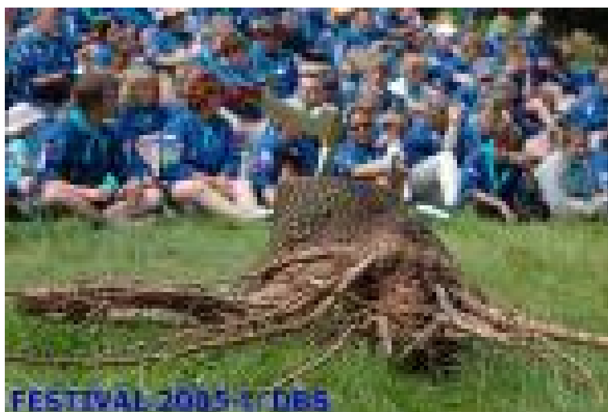
Billede fra Festival 2005 - DBS

Danske Baptistspejderes Landsgilde er stiftet 1954